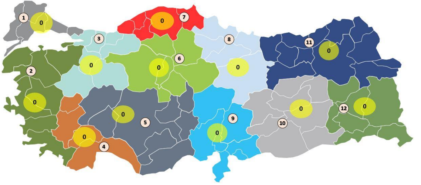
3-ANA KAYNAĞI RÜZGAR VEYA GÜNEŞ ENERJİSİ OLAN ÜRETİM LİSANSI SAHİPLERİ TARAFINDAN YAPILACAK ELEKTRİKSEL GÜÇ ARTIŞ TALEPLERİ İÇİN KAPASİTELER (MW)